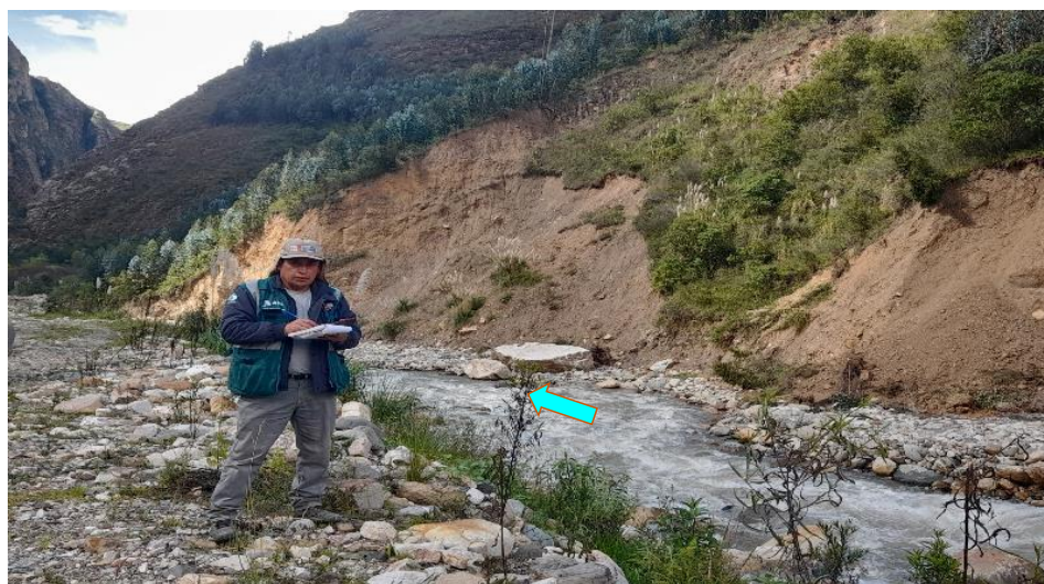
FIGURA N°03: EN EPOCAS DE INCREMENTO DE CAUDAL SE PROPONE UN ENROCADO EN LA MARGEN IZQUIERDA COMO MEDIDA DE PROTECCION EN EL EDEN