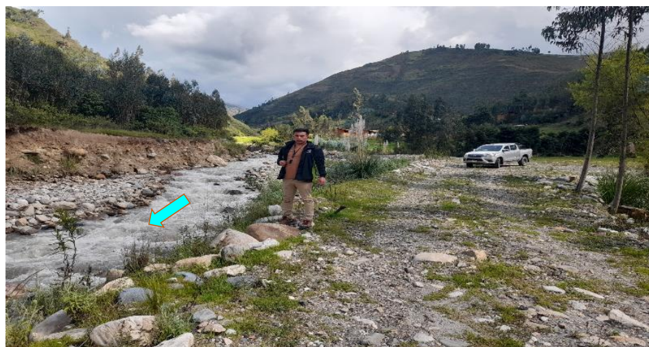
FIGURA N°02: SE VISUALIZA QUE REQUIERE DE MANTENIMIENTO Y PROTECCION EN LA MARGEN IZQUIERDA EN ESTE TRAMO DEL RIO CERPAQUIÑO SECTOR EL EDEN