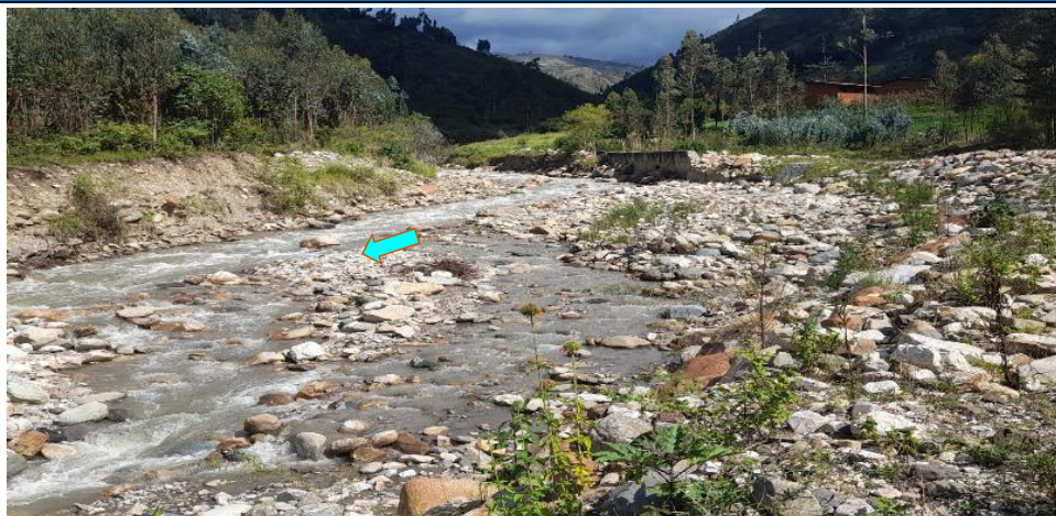
FIGURA N°01: TRAMO CRÍTICO EN EL RIO CERPAQUIÑO SECTOR EL EDEN SE APRECIA AGUAS ABAJO LA POSIBLE EROSION DE LA MARGEN IZQUIERDA